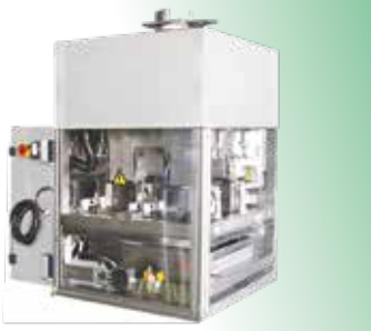
CUT-GATE LİNEER TERAZİ