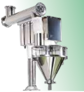
TOZ MAMÜL VİDALI DOLUM ÜNİTESİ