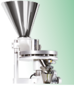
VOLUMETRİK DOLUM SİSTEMİ